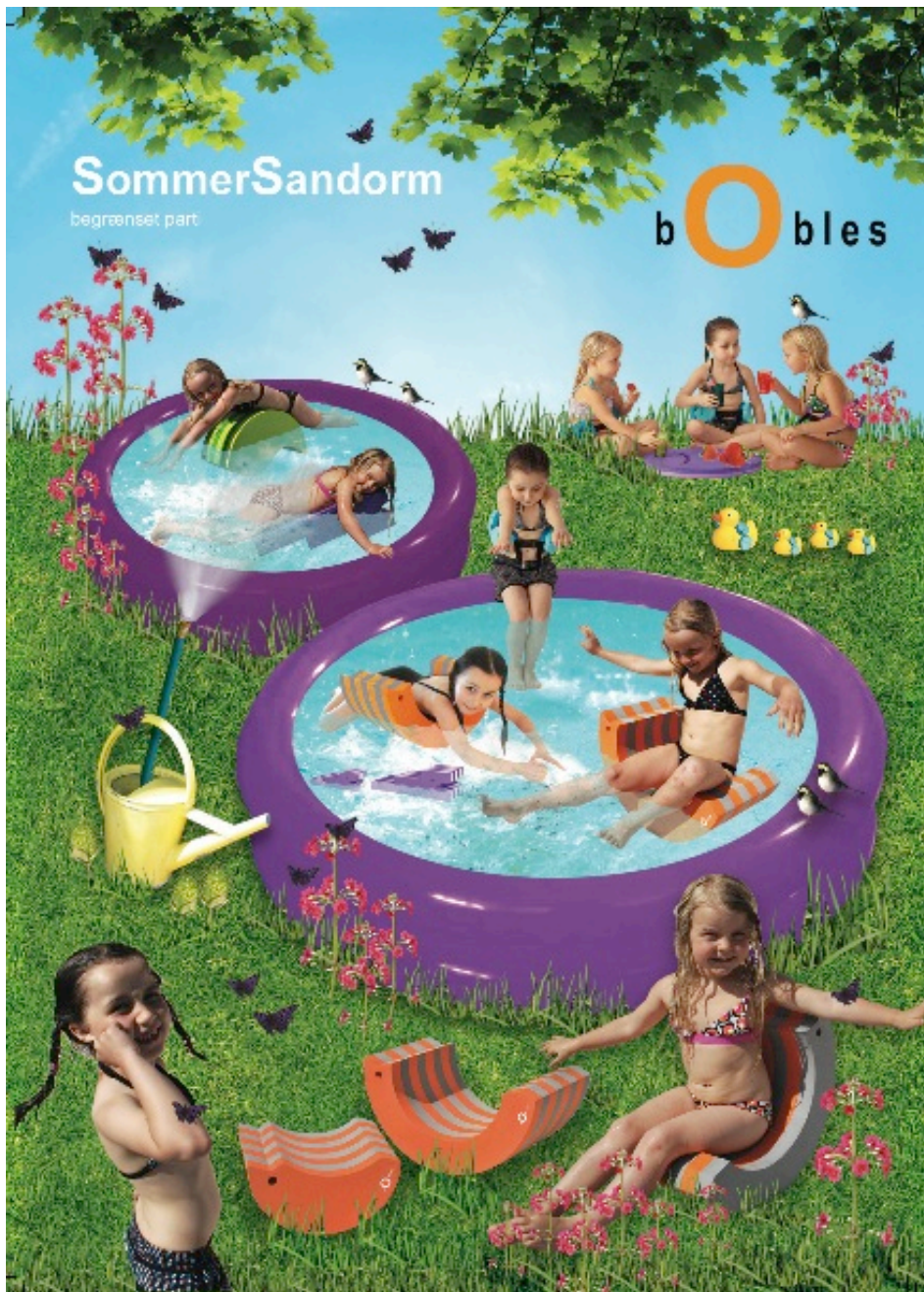
Pressemeddelelse bObles Sandormen Sommer 2011